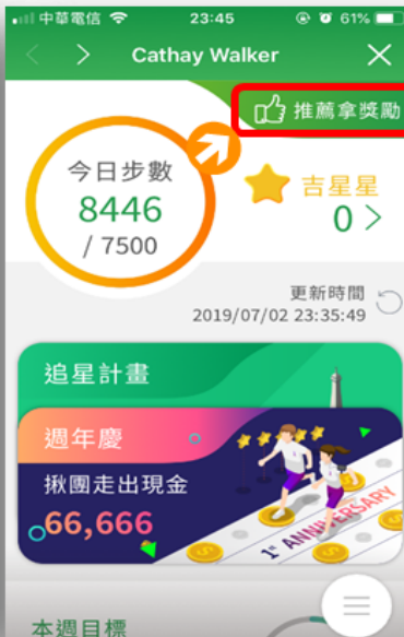
點選右上角 推薦拿獎勵