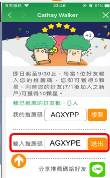
被推薦人點 「送出」推薦碼