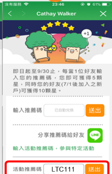
被推薦人輸活動 推薦碼「LTC111」