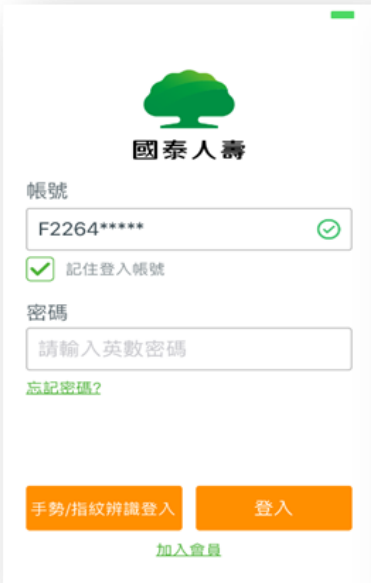
註冊及登入 國泰人壽App