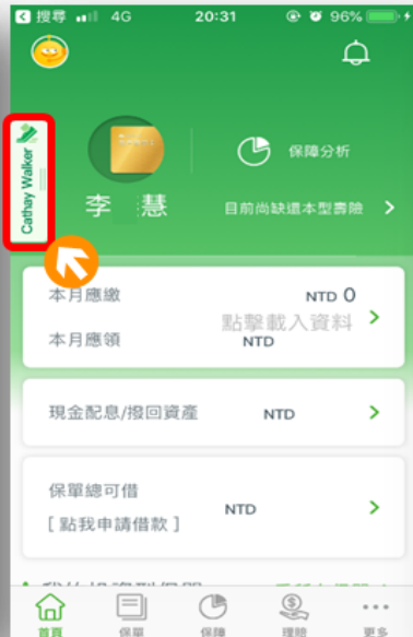
點選左上角 Cathay Walker