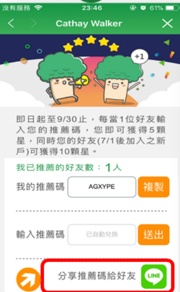
點選「分享 推薦碼給好友」